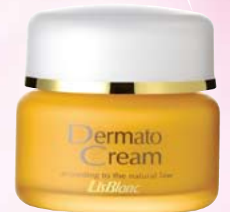
リスブラン薬用 ダーマトクリーム

〈薬用クリーム〉32g ¥15,750(税込) うるおいを長時間キープして、しっかり保湿するタイプのクリームです。ふっくらとした弾力のある、なめらかな膚へ導きます。