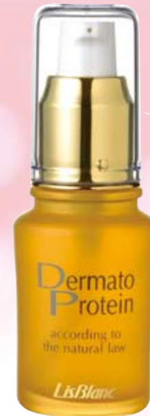
リスブラン薬用 ダーマトプロテイン

〈薬用美容液〉30mL ¥12,600(税込) 乾燥しがちな膚をうるおいで満たし、弾むように、しなやかなうるおい感を与える、薬用美容液です。